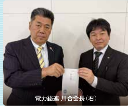
電力総連 川合会長(右)