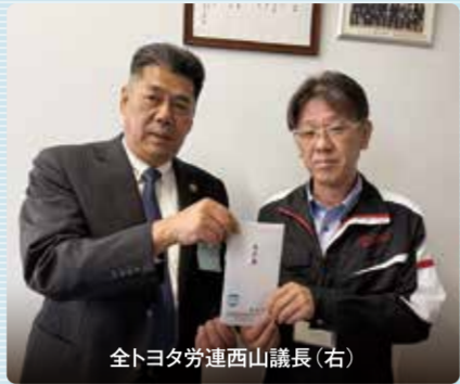
全トヨタ労連西山議長(右)