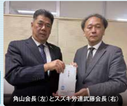
角山会長(左)とスズキ労連武藤会長(右)