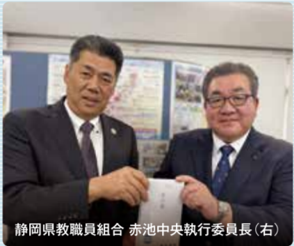
静岡県教職員組合 赤池中央執行委員長(右)