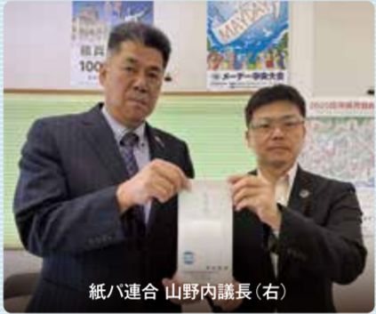
紙ハ連合 山野内議長(右)