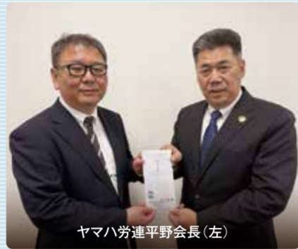
ヤマハ労連平野会長(左)