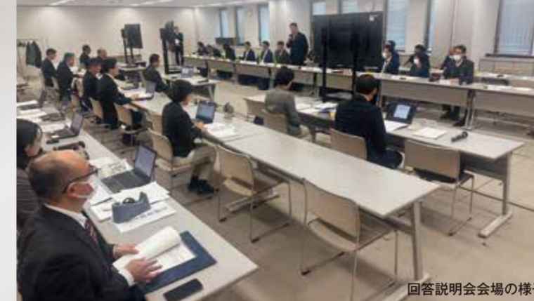
回答説明会会場の様子

日時: 2026年3月23日(火) 13:15~16:50 場所: 静岡県庁別館2階会議室ABCD 対応者: 連合静岡角山会長および政策委員会メンバー 計17名 説明者: 鈴木知事ほか関係局長課長 内容: ①26年度予算の概要説明(鈴木知事) ②回答内容に基づく質疑応答・意見交換