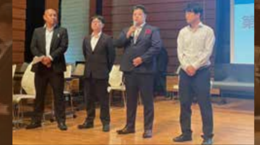
連合未来塾第10期生によるプレゼンテーション