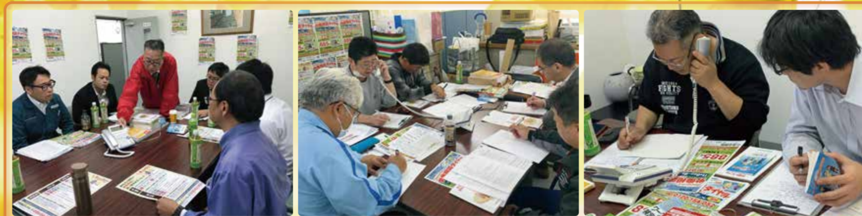
西部事務所では、同じ地協のメンバーがチームになって1つの相談の相談員を務めます。「この法律が適用されるよ!」「こんなアドバイスもできそうだね!」どんなことでも一人で我慢せずに安心して相談してほしいです。

連合静岡では、地域別最低賃金の金額改正(静岡県は10月4日発効)の周知徹底を目的に、「秋の労働相談ダイヤルキャンペーン」を実施しました。11月6日(水)~8日(金)にかけ、3日間にわたって実施した相談ダイヤルには多くの相談が寄せられました。今回も3ブロックにおいて地協の役員の方に相談対応をいただきました。