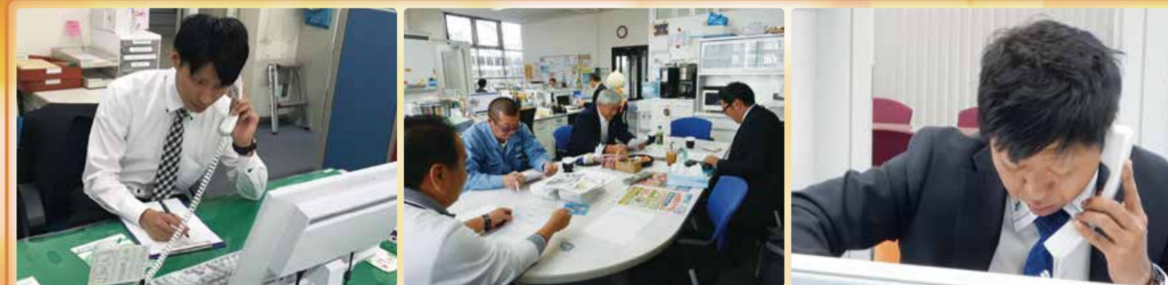
中部事務所や東部事務所でも地協役員が中心となって相談対応を行いました。今回のキャンペーンテーマは最低賃金の周知。相談の中には、最低賃金を明らかに逸脱しているケースもあり、状況を丁寧に聴かせていただきました。