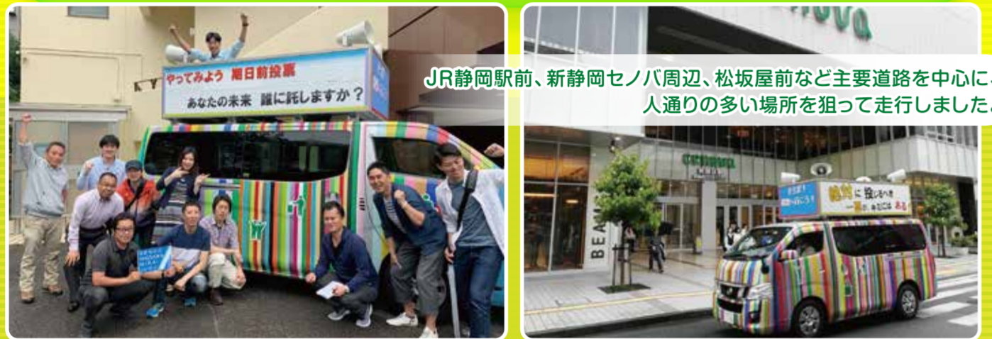
JR静岡駅前、新静岡セノバ周辺、松坂屋前など主要道路を中心に、人通りの多い場所を狙って走行しました。

テーマ：若者に政治に関心を持ってもらうためには 実施日：2019年6月15日(土)