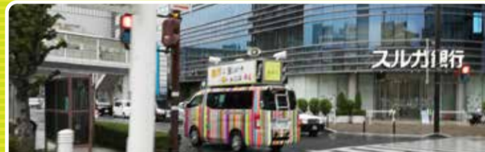
塾生がマイクリレーで一票の大切さを呼びかけました。