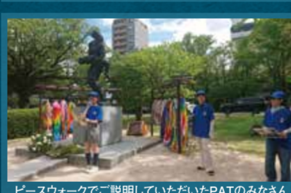
ピースウォークでご説明していただいたPATのみなさん