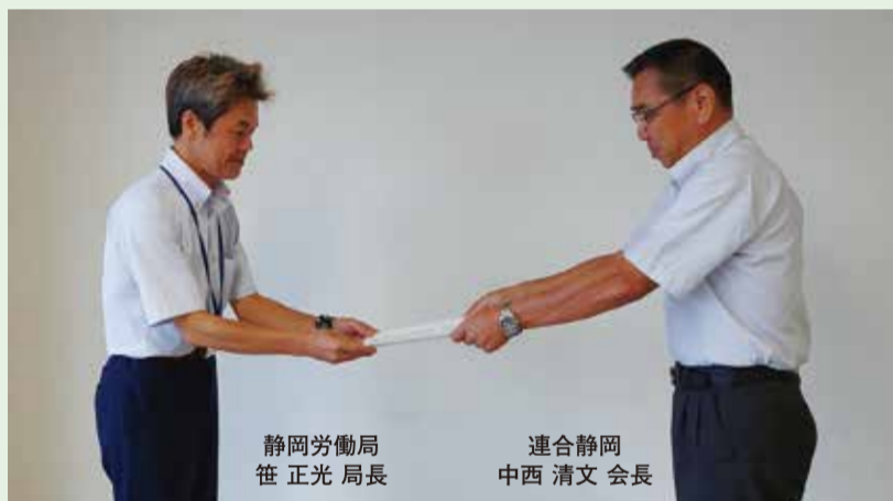
静岡労働局 佐々木 局長