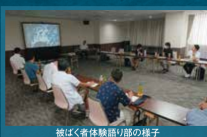
被ばく者体験語り部の様子