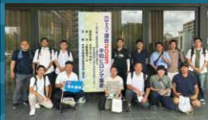
平和ヒロシマ集会の会場にて