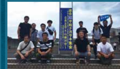
平和ナガサキ集会の会場にて