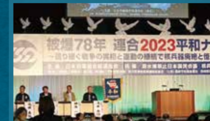
平和ナガサキ集会の様子