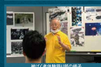
被ばく者体験語り部の様子