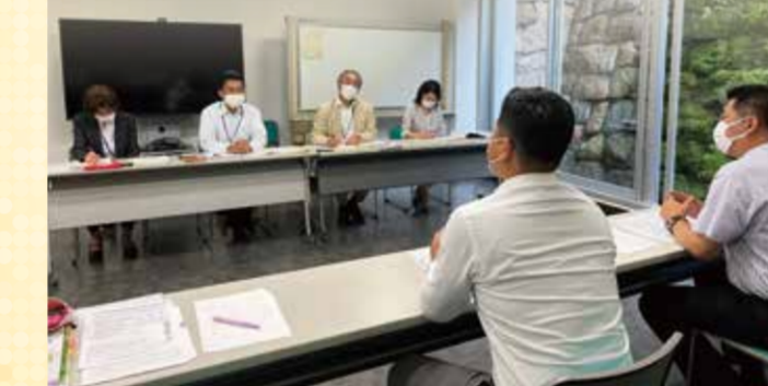
▲日ごろの均等行政について活発な意見交換ができました。