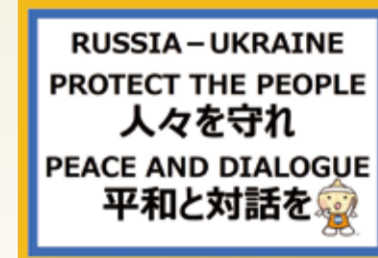
アピールボードに使用したパネル