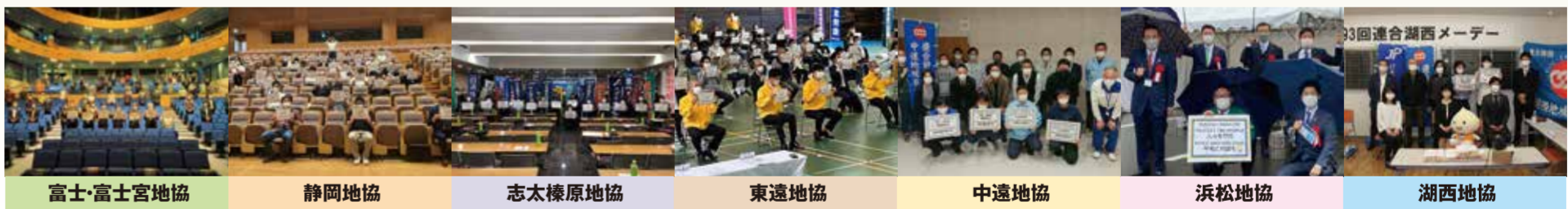
富士・富士宮地協