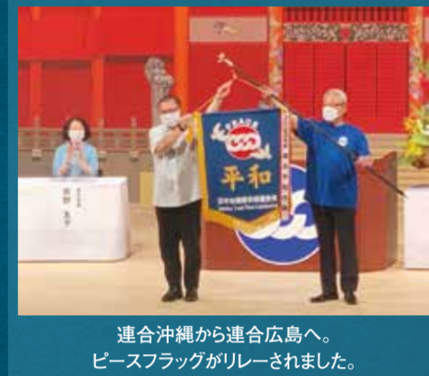
連合沖縄から連合広島へ。ピースフラッグがリレーされました。