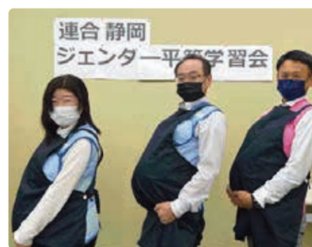
みんなで妊婦になりきり...