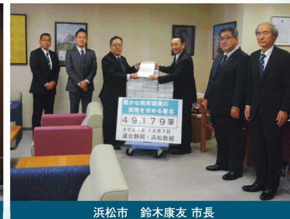
浜松市 鈴木康友 市長