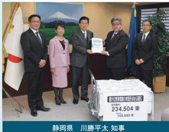
静岡県 川勝平太 知事