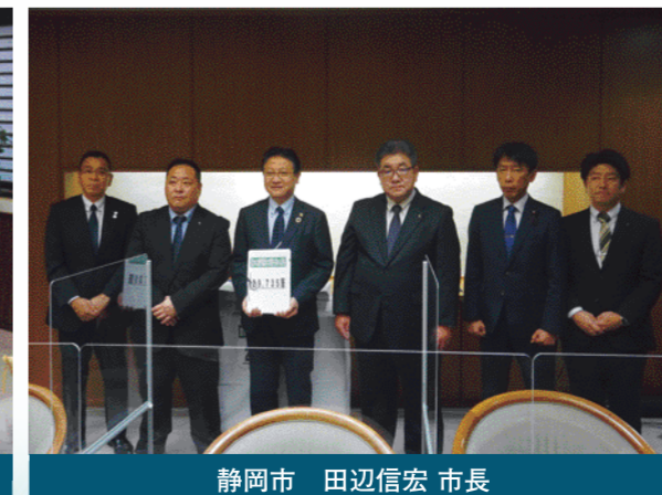
静岡市 田辺信宏 市長